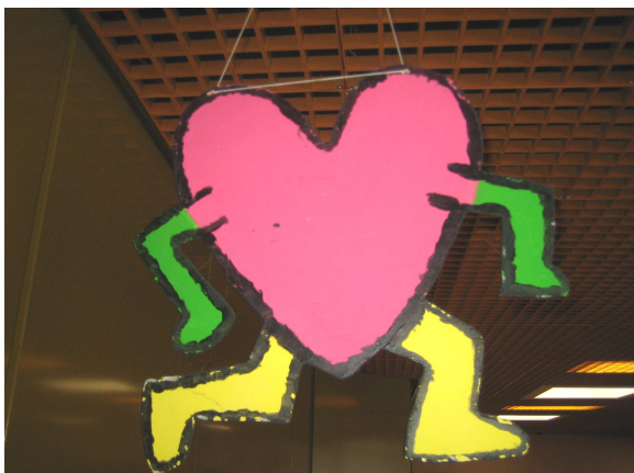
Schule mit Herz (Schülerarbeit in der Pausenhalle)